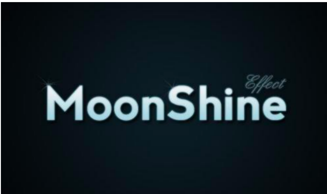
Kuva 4.1: Tekstitunnistettava kuva (Patel et al., 2012)